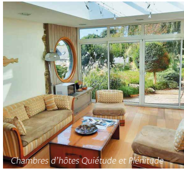
Chambres d'hôtes Quiétude et Plénitude