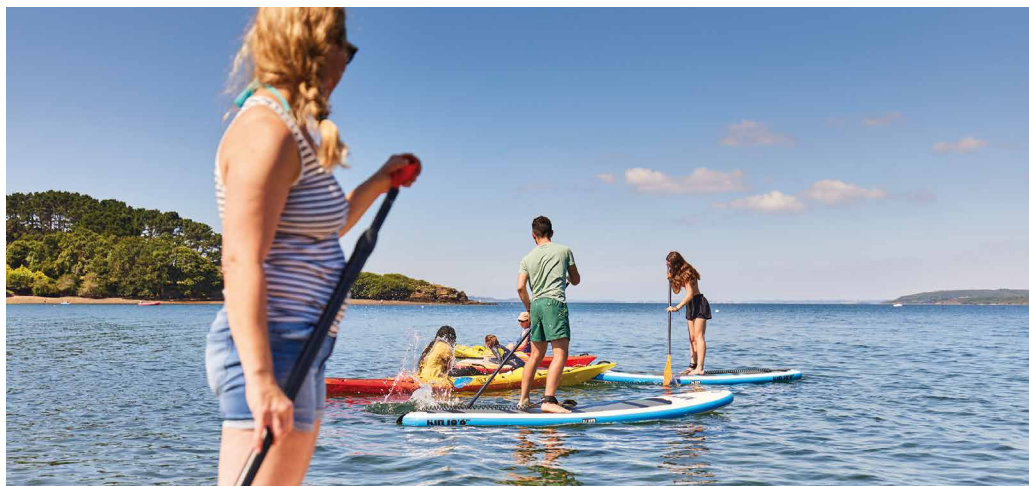
Centre nautique de Moulin Mer