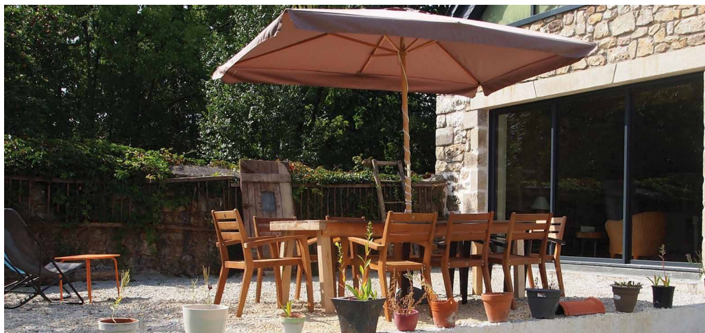
Chambres d'hôtes la Halte de Coat Carrec