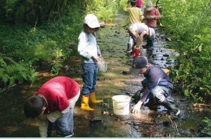
Ti Menez Are