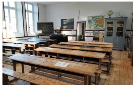
Musée de l'école rurale en Bretagne

Un voyage dans le temps, dans le paysage et dans l'histoire de la scolarisation des campagnes bretonnes. Expositions, reconstitutions et animations ■