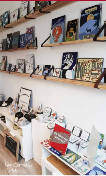
Les Carreaux du Menez

Musée de l'ancienne abbaye de Landévennec