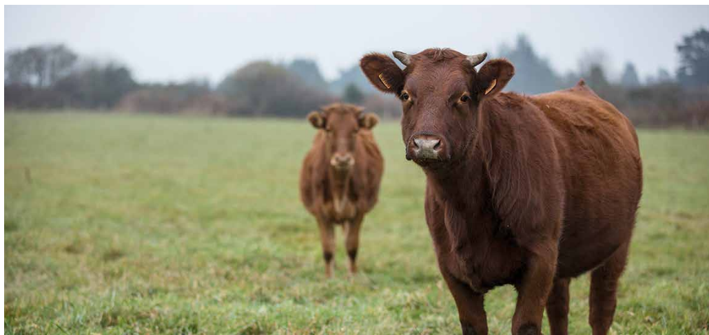
La vache armoricaine