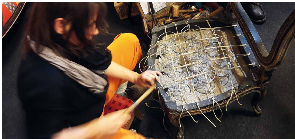
Nom d'un Crin