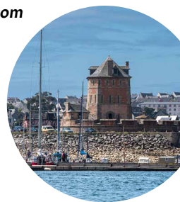
Centre d'interprétation de la Tour Vauban