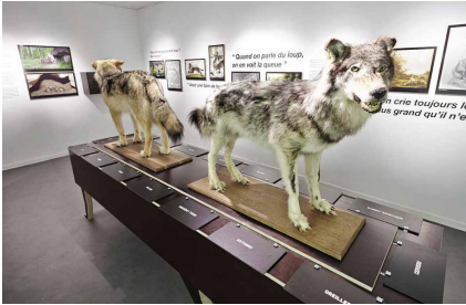
Musée du loup

À travers son exposition permanente et ses expositions temporaires, le musée vous raconte l'histoire du loup d'ici et d'ailleurs. De nombreuses animations sont proposées ■