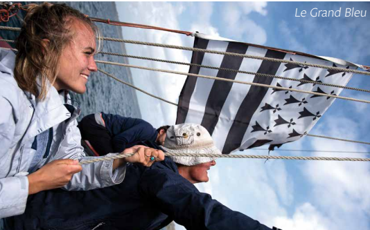
Le Grand Bleu