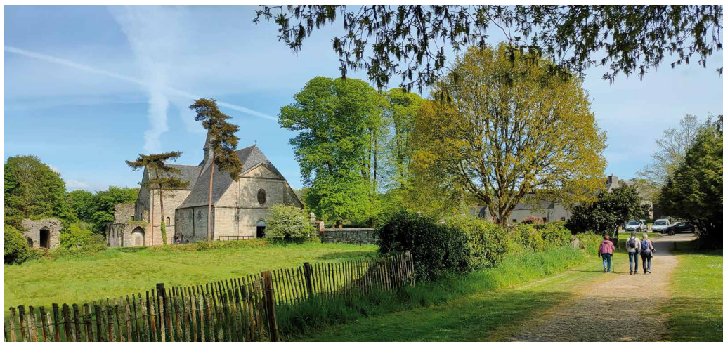
Abbaye du Relec