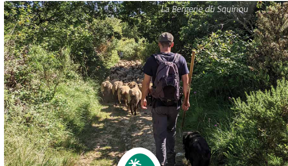
La Bergerie du Squiriqu

HÉBERGEMENTS, SITES CULTURELS, ANIMATIONS NATURE & CULTURE, SORTIES EN MER, ARTISANAT D'ART, PRODUITS AGRICOLES