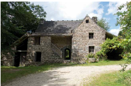
Écomusée des Monts d'Arrée - Maison Cornec

L'Écomusée regroupe les Moulins de Kerouat, ancien village de meuniers, et la maison Cornec, lieu de rencontres et échanges autour du monde rural. Nombreuses animations et exposition temporaire ■