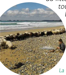
La ferme de Kerguillé

Élevage de moutons en races rustique et locale. Vente directe à l'AMAP de Crozon et dans les magasins de producteurs Goasven et l'Abeille et la bêche ■