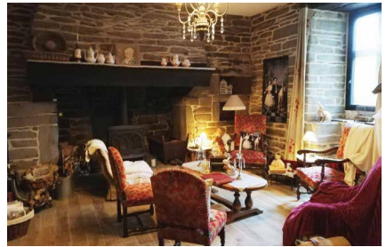
Manoir de Pen ar Voas